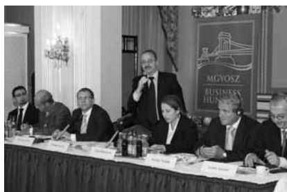
Zaključna konferenca v Budimpešti, september 2010.

Da bi izboljšali informiranost delodajalcev v zvezi z udeležbo zaposlenih pri dobičku, je ZDS v letošnjem letu izvedlo 3 seminarje, na katerih so udeleženci med drugim izvedeli tudi kakšne rešitve nudi obstoječa zakonodaja in kaj prinaša novi zakon.