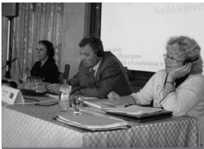
Generalni sekretar ZDS je predstavil dobro prakso slovenskega socialnega dialoga.

ALBANIJA: TIRANA, MAKEDONIJA: ŠTIP, 28.9.-1.10.2010 – Generalni sekretar ZDS je v okviru delavnic, ki jih organizira Mednarodna organizacija dela (ILO) za zahodni Balkan, albanskim in makedonskim socialnim partnerjem predstavil razvoj in usmeritve ter dobre prakse socialnega dialoga v Sloveniji.