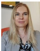
Zbrala in povzela: Mag. Tatjana Pajnikihar Napret

V začetku jeseni je SBC – Klub slovenskih podjetnikov sprožil akcijo za pregledne plačne izpiske oziroma plačilne liste zaposlenih z dvema ključnima ciljema: (1) da zaposleni s 5 ključnimi podatki na vrhu plačnih izpiskov hitro vidijo, koliko so pravzaprav zaslužili v celoti, koliko od tega so plačali davkov in prispevkov, koliko pa so prejeli neto plače, in (2) da ločeno vidijo, koliko so prispevali vsak mesec za bodočo pokojnino in koliko za zdravstvo.